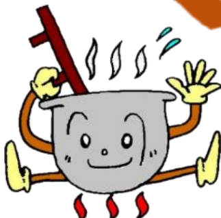
富山市子どもの村イメージキャラクター ごえもんちゃん

スポ協 HP https://www.taikyou-toyama.or.jp/ 子どもの村 HP https://www.knei.jp/~child.v/